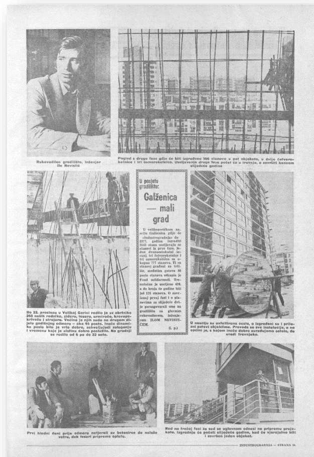
Novine Industrogradnja, članak o izgradnji naselja Galženica I i II, 1974.

U novoizgrađenom naselju Galženica, na Trgu Veljka Vlahovića, odnosno današnjem Trgu Stjepana Radića, 1980. godine otvoren je Dom kulture, čiji projekt potpisuje arhitektica Hrvojka Paljan, a u njemu je otvorena i prva velikogorička galerija za suvremenu umjetnost te knjižnica i manja dvorana za koncerte, predstave i filmske projekcije. Arhitektonsko-urbanističko rješenje stambenog naselja Galženica III, s planiranih 1.260 stanova za oko 4.000 novih