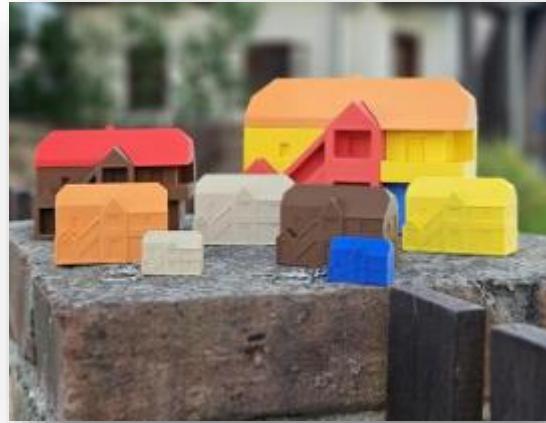
Josip Kos, figurice 3D čardaka, 2024.

čardaka i njegovim karakteristikama u tradicionalnom, ali i modernom ruhu. Josip Kos, član KUD-a Dučec osmislio je jedinstvenu liniju proizvoda 3D printanih čardaka u obliku privjeska, magneta, figurice te slagalice za samostalno slaganje. Uz to, radionica će sadržavati rad s 3D olovkama pomoću kojih polaznici radionice mogu izrađivati tradicionalne turopoljske motive poput podgutnice, čardaka i slično