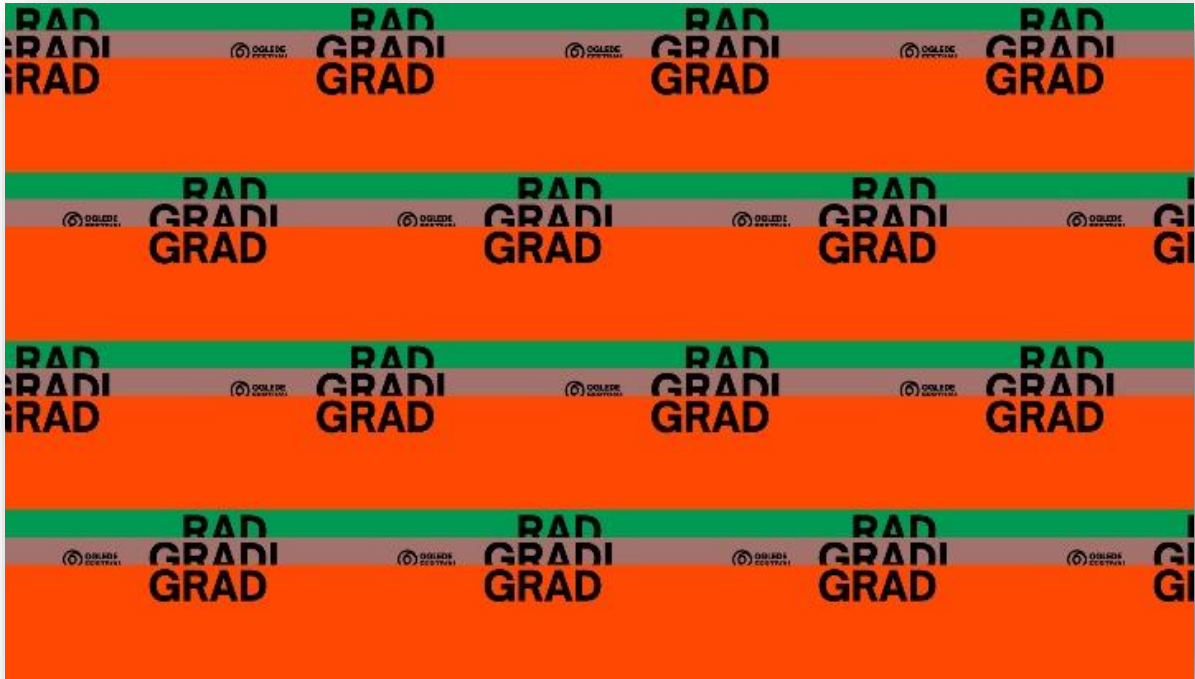
O'glede, dizajn Kreativna agencija Vrisak, 2025.

Treće izdanje „Oglede“ festivala odvija se pod nazivom „Rad gradi grad“ , baveći se radom kao temeljnom ljudskom aktivnošću koja oblikuje ne samo društvene odnose, vrijednosti, stavove, naše slobodno vrijeme i ideje već i fizičke prostore – kvartove, ulice, gradove.