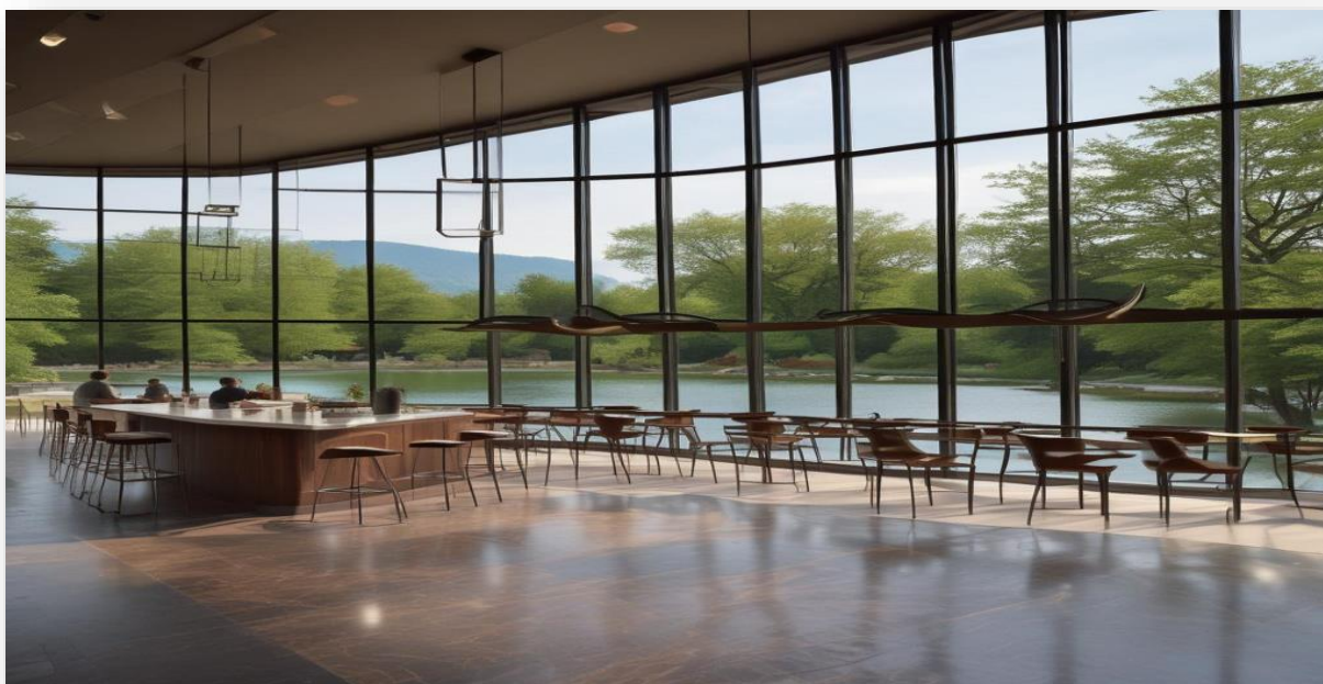
Primjer arhitektonskih prijedloga s KulTurFesta 2024

KulTurFest je manifestacija suvremene umjetnosti koja ove godine posebnu pažnju