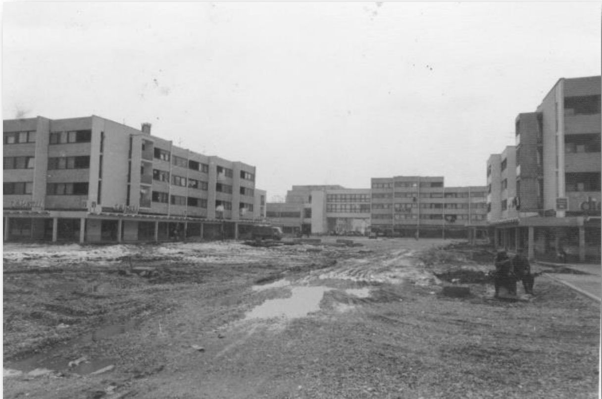
Naselje Galženica III, Velika Gorica

Izgradnja naselja s kvalitetno koncipiranim urbanističkim planom, stanogradnjom,