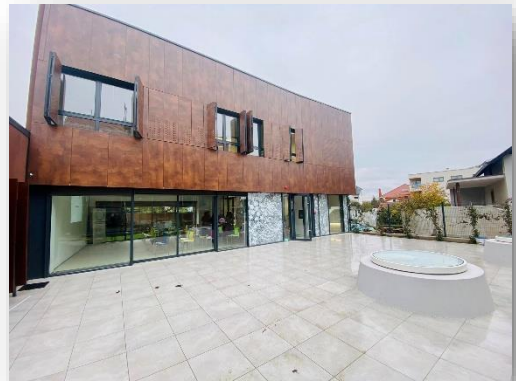
Interpretacijski centar Muzeja Turopolja u Velikoj Gorici, 2024.